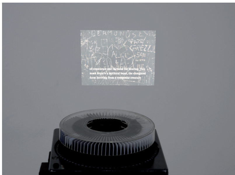
Untitled (Mask) II 2007 17 different diapositives, dia projector